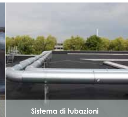
Sistema di tubazioni